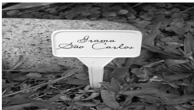
Plaquetas de identificação - Ilustração 1: 9 cm na parte para se escrever